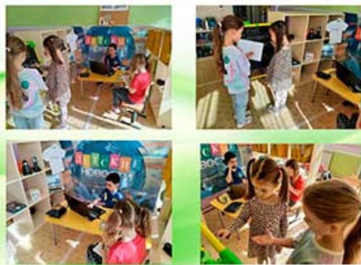
Занятия по УМК