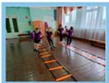
Заяц бежит от волка