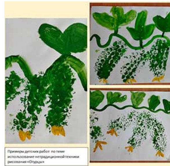
Примеры детских работ по теме использование нетрадиционной техники рисования «Огурцы»

Для себя и для друзей. (Округляют левую руку как лукошко, а правой рукой «кладут» в неговоображаемые овощи.