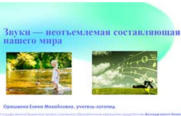
Звуки — неотъемлемая составляющая нашего мира

Учитель-дефектолог, МБОУ Видновская СОШ № 7, г. Видное, Московская область